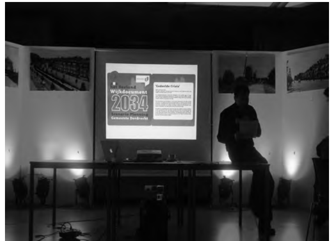
Scenarioplanning Dordrecht: inleiding

Deze drie uiteenlopende voorbeelden illustreren de kracht van sociaal duurzame investeringen. Niet zozeer een kortstondig projectrendement staat daarbij voorop, maar de duurzaamheid van de investering. De duurzaamheid zit hem in de manier waarop de investering aansluit bij wensen en behoeften van bewoners en de manier waarop de resultaten zichzelf in standhouden en mee kunnen groeien met de veranderende wensen en behoeften. Dat maakt het meten van het maatschappelijk rendement van sociale investeringen niet eenvoudiger. Duurzaamheid krijgt namelijk niet of nauwelijks aandacht in een meting en dat is zonde. De focus zou juist moeten liggen op het installeren en beheren van processen die openheid, continuïteit en flexibiliteit in zich hebben. Het installeren van een proces kan gezien worden als de projectfase. Dit is het moment waarop het initiatief, het project, de interventie plaatsvindt. Het doel daarvan is echter iets duurzaam in gang te zetten. Helaas, hoe graag we ook willen, het perpetuum mobile is nooit uitgevonden, zeker niet voor sociale investeringen. Daarom is goed beheer noodzakelijk, oftewel nazorg en blijvende aandacht. Maar door aan de voorkant goed na te denken hoe een investering zo ingericht kan worden dat de openheid, continuïteit en flexibiliteit gewaarborgd zijn, kunnen deze investeringen sociaal duurzaam zijn.