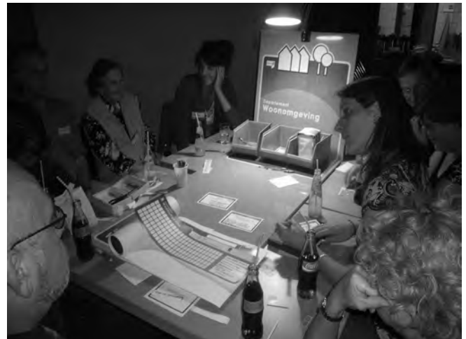
Scenarioplanning Dordrecht: bezig