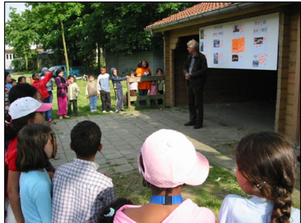
Bekendmaking van het winnende speeltoestel en prijsuitreiking voor het beste fantasiedier.

De middag stond in het teken van spel en dier, met daarbij enkele opdrachten. De opdracht 'Tekende fantasiedier' leverde de meest onwaarschijnlijke beesten op, van wanstaltige gedrochten tot pluizen met een hoog aaibaarheidsgehalte. Bij een andere opdracht moesten de kinderen kiezen uit een reeks van foto's van speeltoestellen. Bij het beste speeltoestel mochten zij een sticker plakken. Het winnende toestel verdween onder de stickers, maar met enige moeite kon hier toch nog een klim- en glijtoestel ontdekt worden.